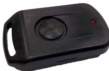
Метка в корпусе.

В отличие от стандартной метки (ActiveTag), данная метка не передает свой код постоянно. Отправка кода метки производится только при нажатии кнопки на корпусе. Метка также снабжена светодиодом, который кратковременно включается только при нажатии кнопки.