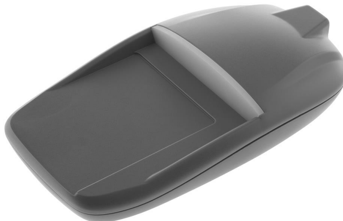
Рисунок 1. Внешний вид считывателя PR-P18

Внешний вид считывателя представлен на рисунке 1.