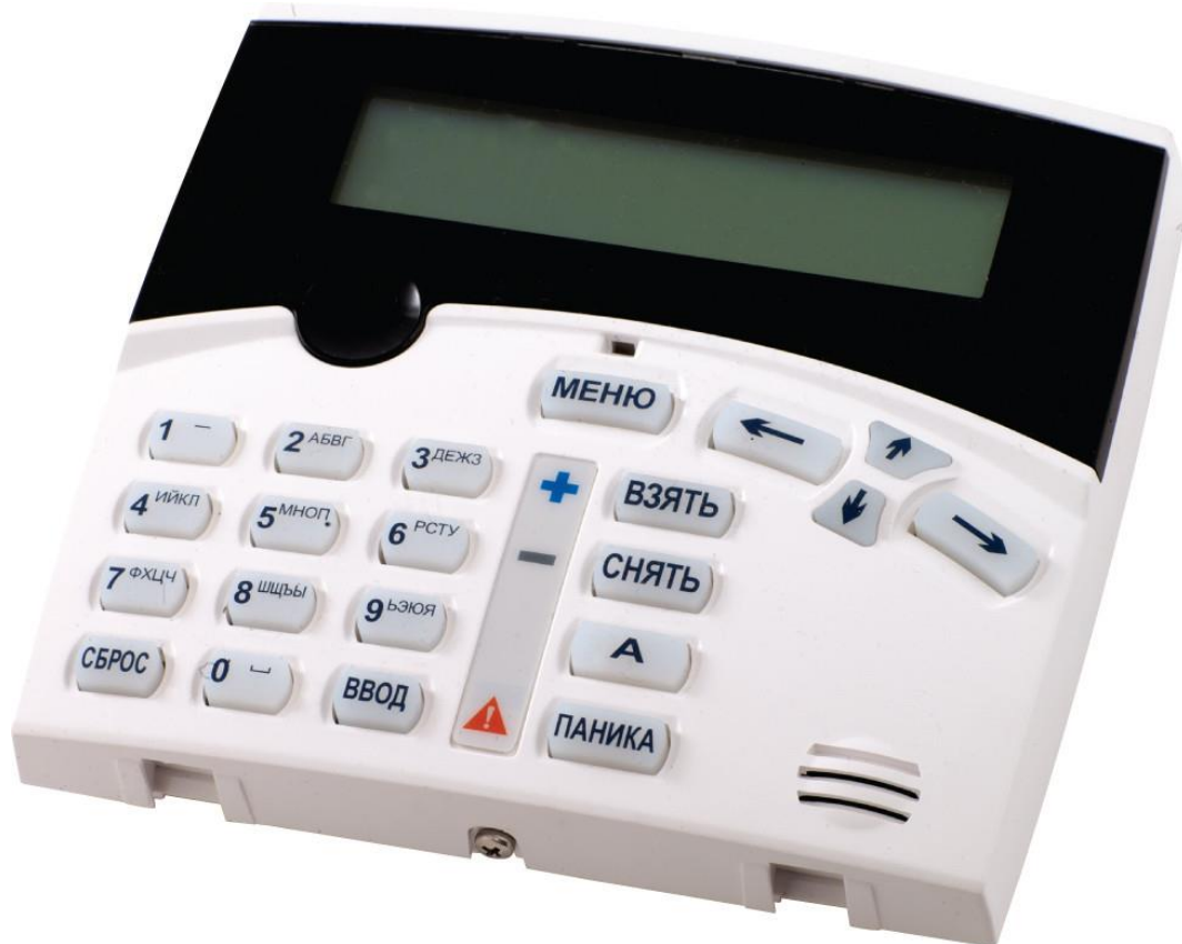
Рисунок 1. Выносная клавиатура АКD-01

Внешний вид клавиатуры представлен на рисунке 1.